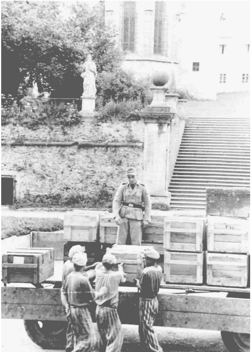
Abbildung 2: Ausladen der Bücher der »Publikationsstelle Wien« im von der SS beschlagnahmten Benediktinerstift St. Lambrecht in der Steiermark, 1944.

Über 150 Deportierte des KZ Mauthausen werden in diesem Außenlager von 1942 bis 1945 zur Zwangsarbeit eingesetzt.